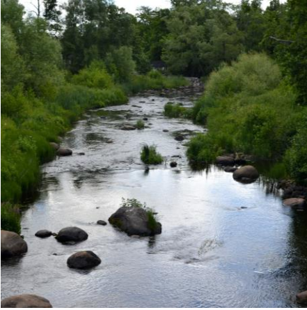
Vramsån, 2022.